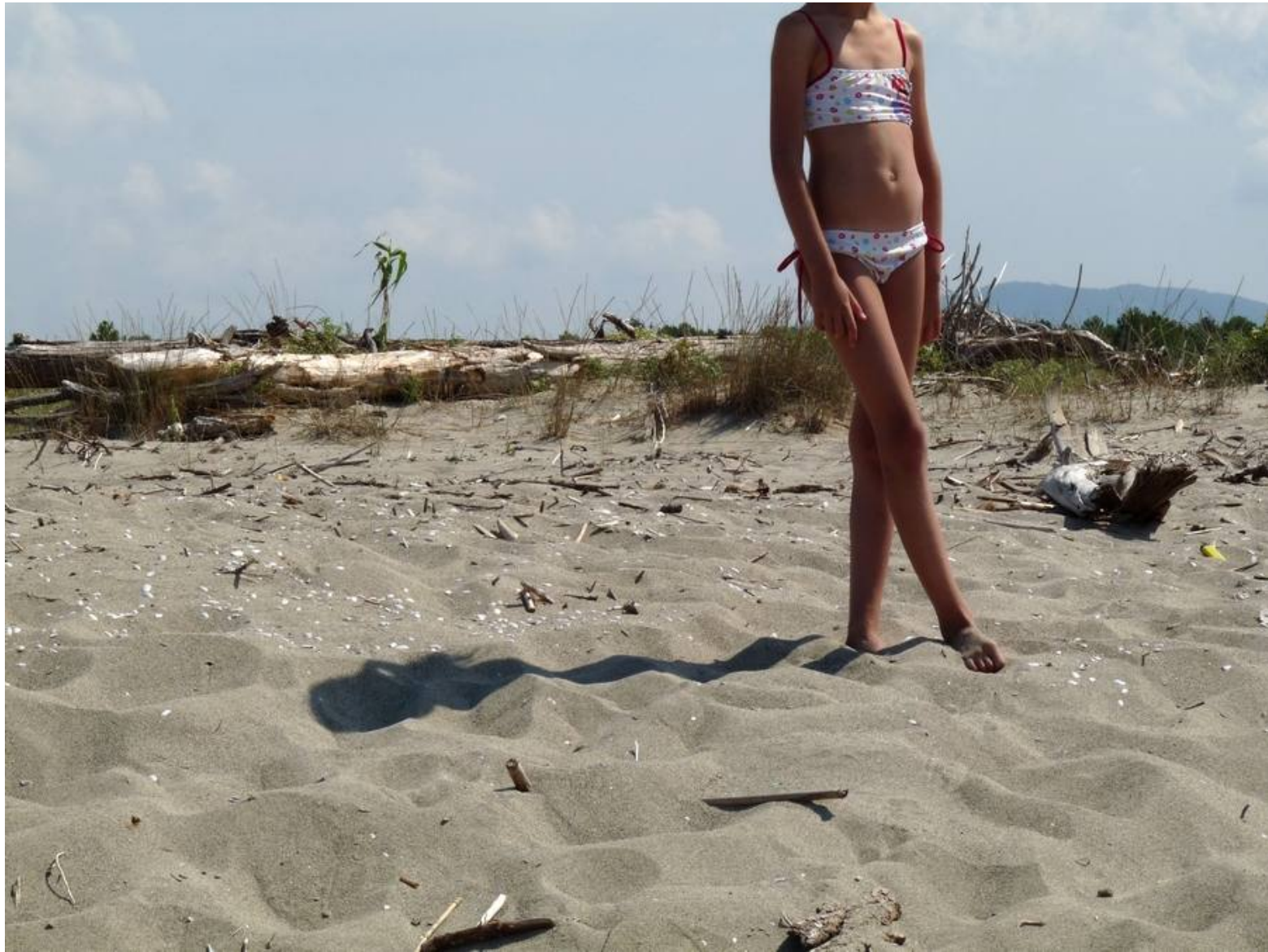
Viareggio, spiaggia della Lecciona