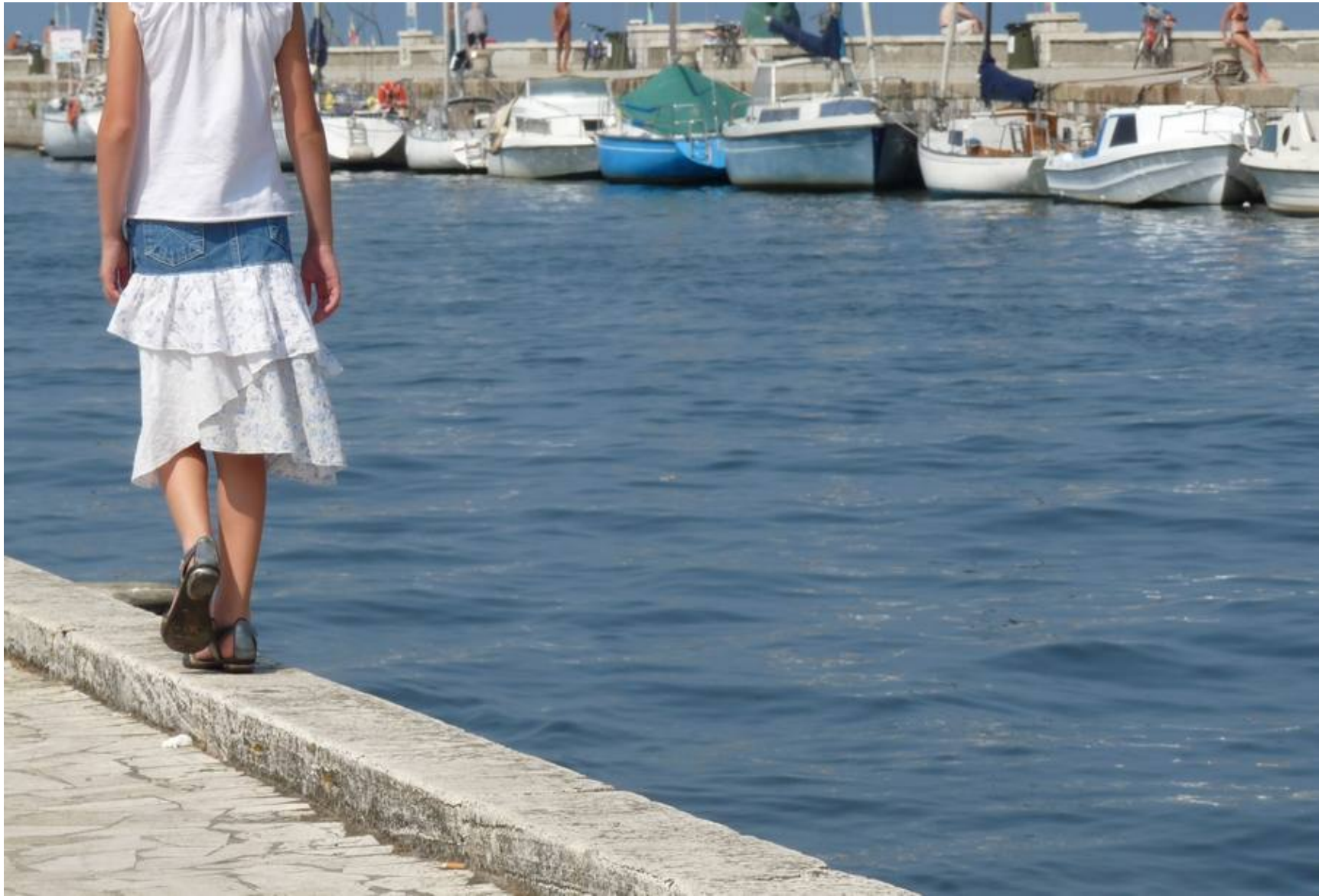
Viareggio, lungo il molo della Darsena