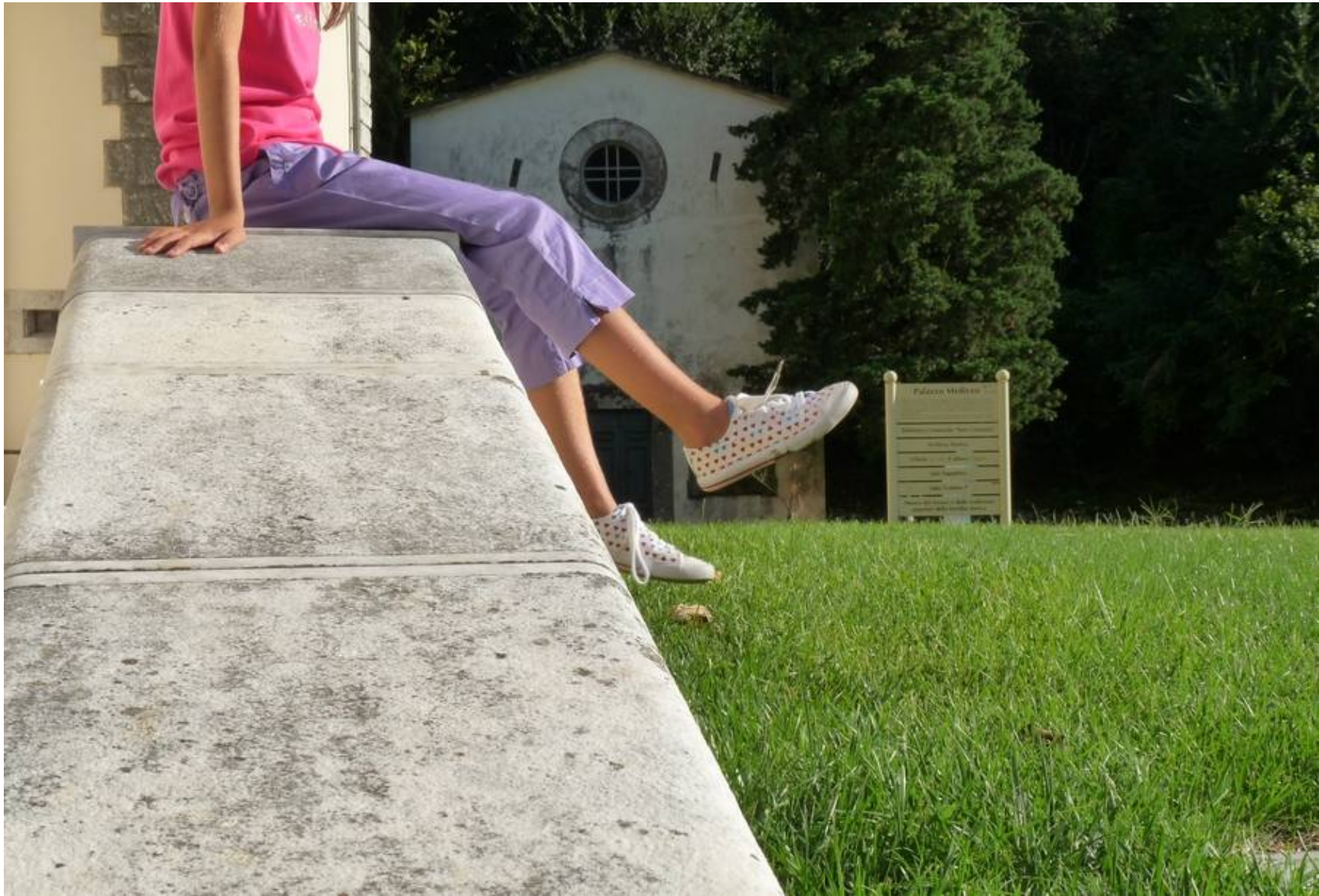
Seravezza, all'ingresso di Palazzo Mediceo