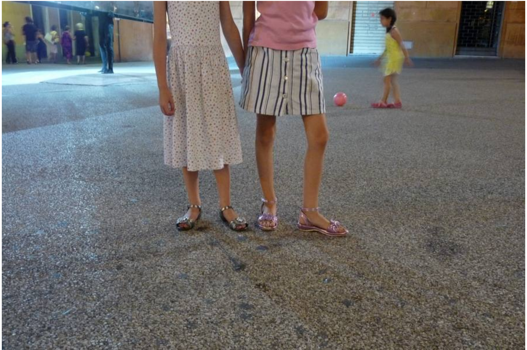
Pietrasanta, in piazza Sant'Agostino